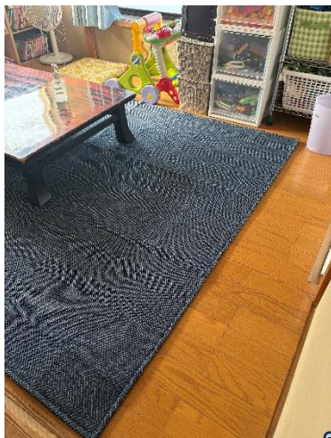
2階和室→フローリングへ

これからのいっぽを文字通り支えてくれる床を大事にしながら、楽しい時間をともに過ごしたいと思います♪