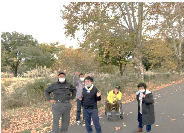
ある日の散歩の様子