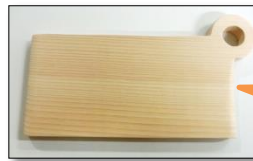
カッティングボード