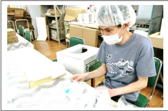
車用品のセット作業

就 B 班は、メンバーさんから「工賃を増やしたい」という希望が多かったため毎日行っていた朝の散歩を月・水・金の3日に減らし作業時間を増やしています。ラジオ体操が終わるとテーブルクロスを用意したり、会議室に資材を取りに行くなど積極的に仕事の準備を始めています。3月から始めた（株）オリエンタルトレイド様の仕事は、月5,000個から8,000個まで納品できるようになりました。