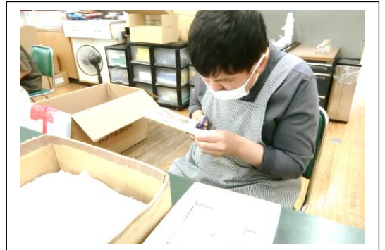
窓付き封筒フィルムの分別