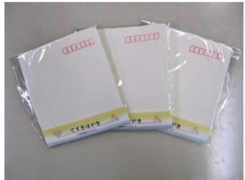
手すきはがき『白』 3枚入り 200円