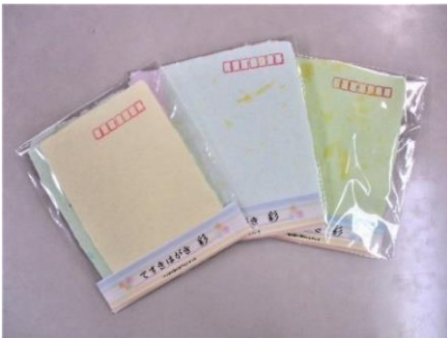
手すきはがき『彩』 2枚入り 250円